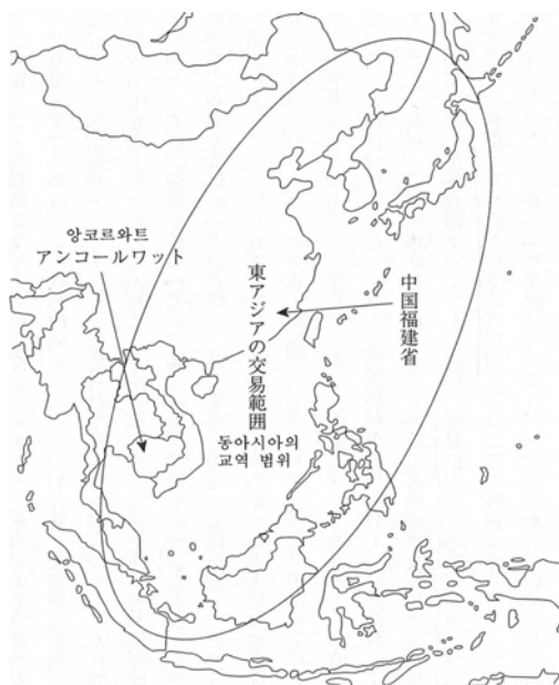
〈그림 1〉 〈동아시아의 대표적인 일본인 마을〉 본서 35쪽 (삽화 속의 한글 캡션은 본 평자에 의한 것임. 이하 동일).

(鄭成功 : 1624-62)의 타이완에서 활동하다가 일본에 망명한 주순수(朱舜水)를 받아들여 미토학(水戸學)이라는 학풍(學風)을 만들어낸다. 미쓰쿠니 당시는 동남아시아 각지와 일본간의 무역 관계가 아직 살아 있었으며, 타이의 일본인 마을(日本町)을 다스리던 야마다 나가마사(山田長政 : 1590-1630)가 타이의 왕위 계승에 개입하다가 살해당하는 등, 수 십 만명의 일본인이 타이·베트남·인도네시아 등 동남아시아 각지에 정착하여 활동하고 있었다. <그림 1>은 그 활동 범위를 제시한 것이며, 저자는 이 지도에서 원 안에 포함되는 지역이 “동아시아”에 해당한다고 간주한다. 미토번주 미쓰쿠니는 이 “동아시아”를 대상으로 한 해외 무역을 통해 이익을 산출하고자 하였으며, 미토번의 해상무역 요충지에 바다의 여