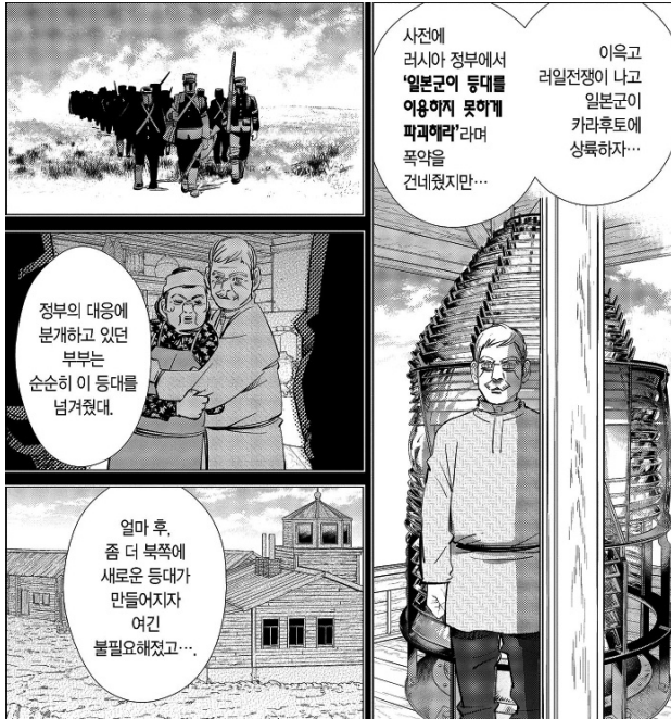
[그림 2] 『골든 카무이』 17권, pp. 157-158

사할린 섬에서의 징역형은 가혹한 개척 노동으로 알려져 있었다. 또한 15년의 징역형기가 끝나도 바로는 자유의 몸이 되지 못한다. 자활하는 유형 입식수로서 10년간 섬 내 정해진 장소에서 살아야 한다. 합쳐서 25년이 지났을 때, 자신은 45세가 된다. 인생에서 가장 풍요로운 시기를 빼앗은 러시아 제국을 브로니스와프는 증오하며, (인생용) 빼앗긴 계기가 되었던 지난 가을을 다시 회상하고 있었다.