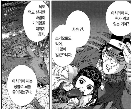
[그림 5] 『골든 카무이』 10권, p. 189.