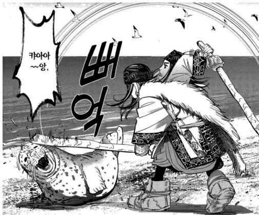
[그림 4] 『골든 카무이』 7권, p. 65