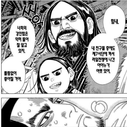
[그림 1] 『골든 카무이』 4권, p. 47

부상당한 채 마을을 찾아온 일본군 병사였던 인물을 아이누인들이 따뜻하게 보살펴 주는 모습이다. 인용문의 대사를 통해서도 확인할 수 있듯이, 이들은 일본군의 강인함 14 을 칭찬하며 혈맹적 동료 의식을 보여 주고 있다.